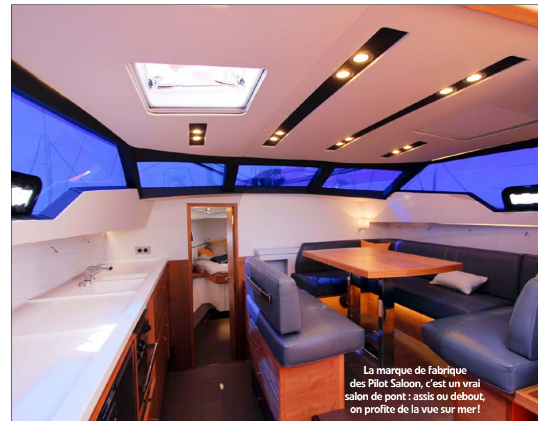
La marque de fabrication des Pilot Saloon, c'est un vrai salon de pont : assis ou debout, on profite de la vue sur mer!

« Carène soignée, gréement élancé, quille plomb en option, le PS 42 est aussi performant que confortable. »