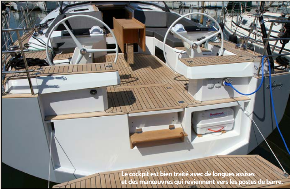
Le cockpit est bien traité avec de longues assises et des manœuvres qui reviennent vers les postes de barre.