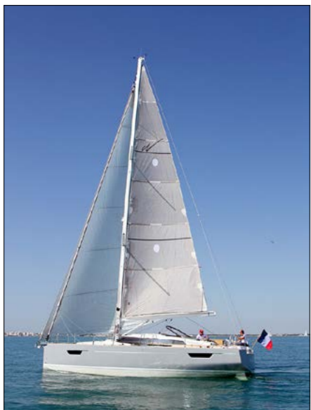
▲ L'envoi des voiles est facilité par une surface de toile bien équilibrée entre génois et grand-voile.

SI LE TOUT PREMIER Pilot Saloon, le PS 60, était empreint d'un classicisme bon teint, la gamme est parvenue, 300 exemplaires plus tard, à coller à l'air du temps. Le PS 42 en est la meilleure démonstration. Fini les étraves et les tableaux arrière inclinés : place à une étrave et un arrière verticaux ou presque. Mais ce n'est pas tout puisque le 42 présente deux bouchains arrière – qui ont été adoucis. Et il est équipé de deux safrans... Comparé au PS 48 amarré juste à notre bâbord, un très net pas vers un design plus contemporain a été franchi. Force est de constater que le résultat est plutôt flatteur, en particulier pour le rouf, imposant et vitré. Grâce à un franc-bord sensiblement relevé, le rouf est moins proéminent, son arrondi moins marqué. Les hublots sont habilement intégrés dans le premier niveau des superstructures à l'avant et dans les hiloires côté cockpit. Et la fameuse lisse en teck est toujours là pour affiner le tout. Bon point également pour le coupe-vent, aussi efficace qu'esthétique. Côté construction, c'est toujours de la belle ouvrage avec une coque en sandwich balsa polyester en infusion. L'accès à bord, et bien sûr la baignade, sont grandement facilités par l'imposante plate-